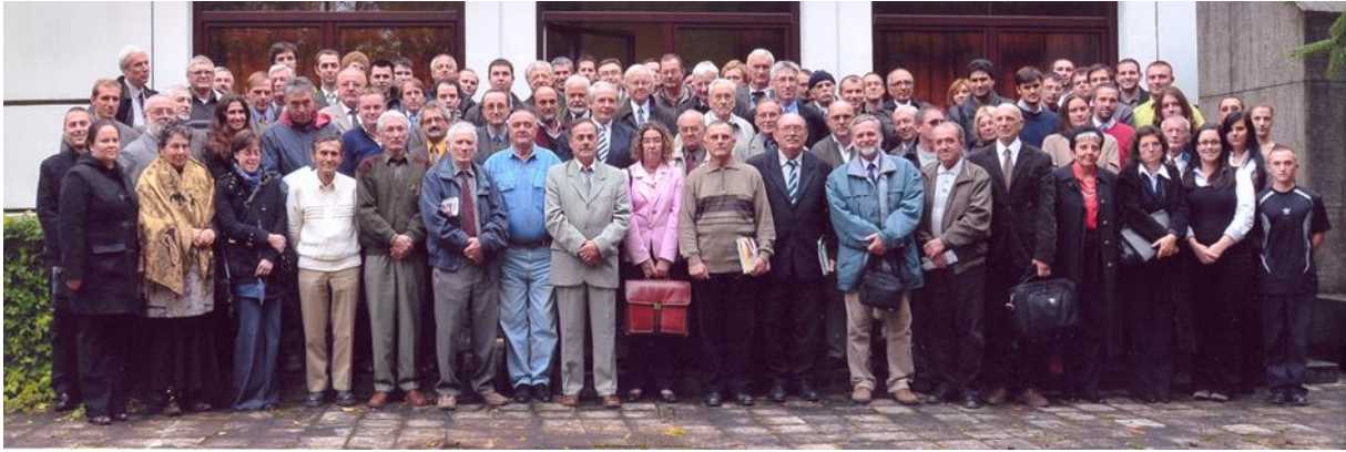
5. ábra A 2010. évi nagylétszámú résztvevő a 15. TNF-en a DAB Székház Bognár Rezső akadémikusról elnevezett nagyterme mögött készült közös fényképen

De mások is fontosnak tartották a visszaemlékezéseket Vörös József (2001), Tuzson Jánosra (2004), Huzián Lászlóra (2010), Liphay Bélára (2011), Horváth Gézára (2023), Sipeki Balás Gézára (2024) vagy a Magyar Tudományos Akadémia Növényvédelmi Kutatóintézete fennállásának 125 éves ünneplésére (2005). Bognár Sándortól 2011-ben nekrológban kellett elbúcsúznunk. 30