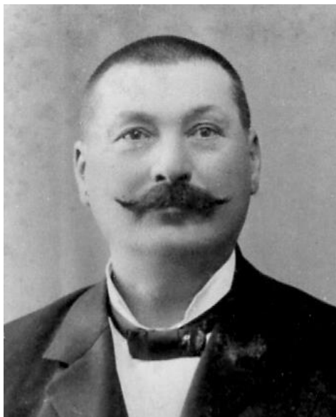
5. ábra Gulyás Antal fiatal tanár az 1920-as években a Gazdasági Akadémián (Debrecen-Pallag)

1975-ben a Debreceni Agrártudományi Egyetem növényvédő érdeklődésű hallgatói csoportja megalakította a “Növényvédelmi Kör”-t, melyet 1984-ben a jeles professzor születésének 100. évfordulóján tiszteletére a “Hallgatók Gulyás Antal Növényvédelmi Köré”-nek nevezték el.