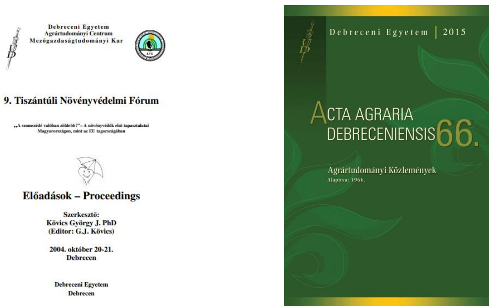
3. ábra A 2004-es és a 2015-ös Proceedings kiadványok fedlapja

A 30 év során minden alkalommal készült egy részletes Programfüzet és egy Kiadvány, (külön-külön, vagy egybe szerkesztve), amelyek különbözőbb formában és tartalommal jelentek meg (3. ábra). Ezek a Tiszántúli Növényvédelmi Fórum – Archívum oldalán minden évre vonatkozóan megőrzésre kerültek és letölthetők. 20