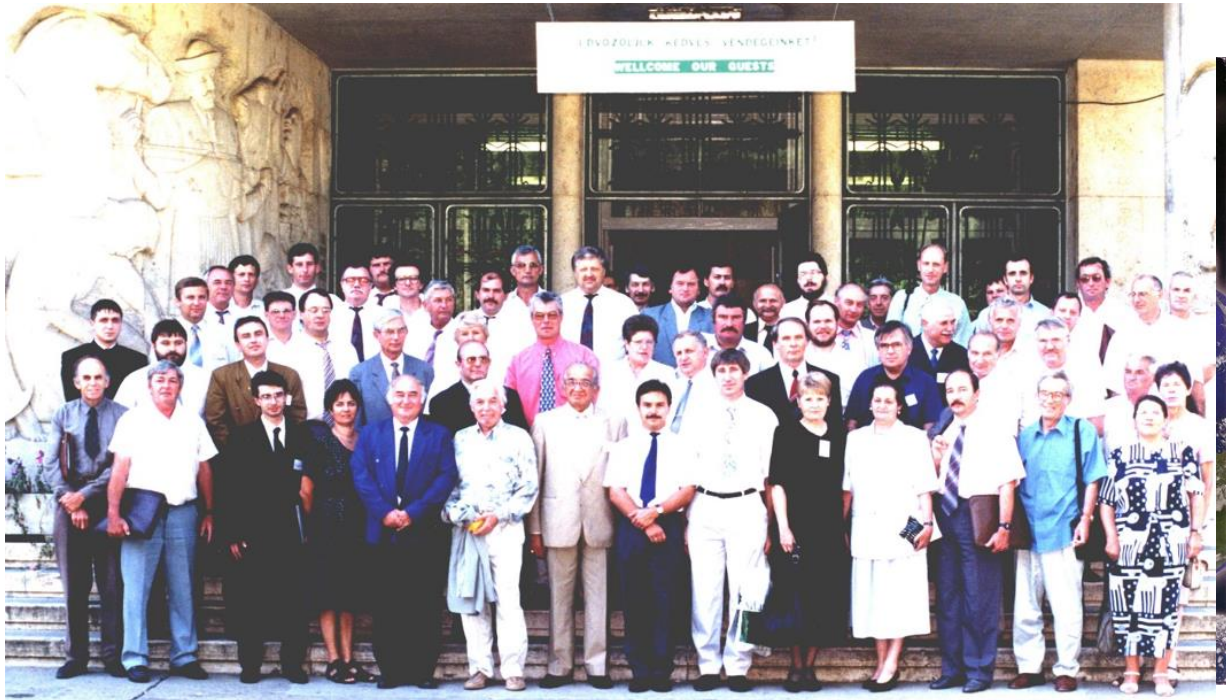
1. ábra Az Első Nemzetközi Növényvédelmi Szimpozion (1st IPPS, 2. TNF) résztvevői, 1997

Az első sorban áll (világoskék zakóját kezében tartva) Vánky Kálmán (1930-2021) világhírű erdélyi magyar orvos – üszöggomba kutató, aki plenáris előadásában az „Üszöggomba taxonómiai kutatás a nagyvilágban és Magyarországon” címmel tartott előadást, továbbá egy “Üszöggomba Kutatás Magyarországon” szekciót is vezetett. Az időközben elhunyt üszöggomba specialistaról tanóráinkon, mint a szűkebb szakmánk egyik, világhírnévre szert tett példaképéről rendszeresen megemlékezünk! 18 A „több mint 50 év üszöggombáknak szentelt munka és szórakozás csúcspontja (Vánky)”, munkáját önmaga ekként jellemezte (2. ábra).