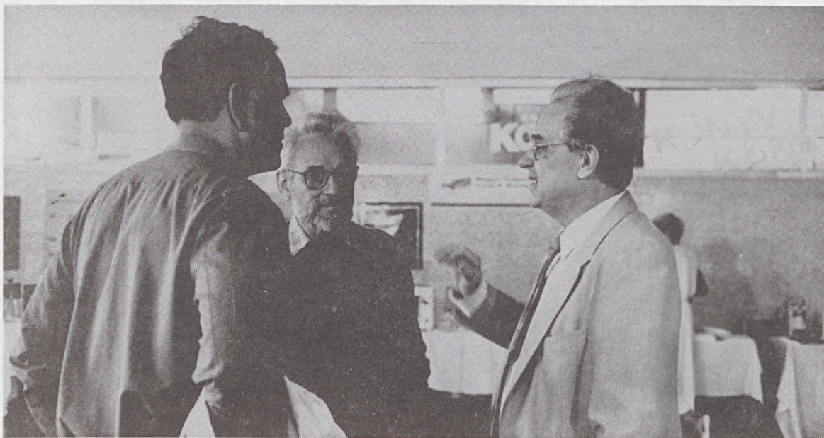
Szakmai konzultáció zajlik az egyik kiállító cég standjánál.