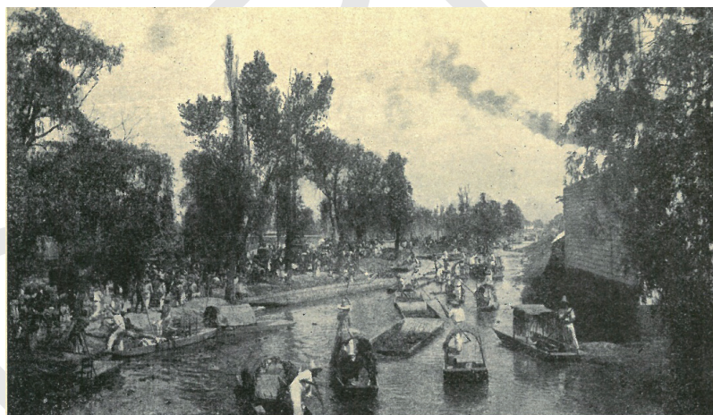
ÜNNEPÉLY A VIGA CSATORNÁN, MEXIKÓBAN.