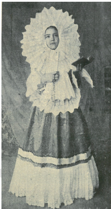
TEHUNTEPEC-I JOBBMÓDÚ MUNKÁSNŐ TEPLOMI ÖLTÖZETE (MEXIKÓ).