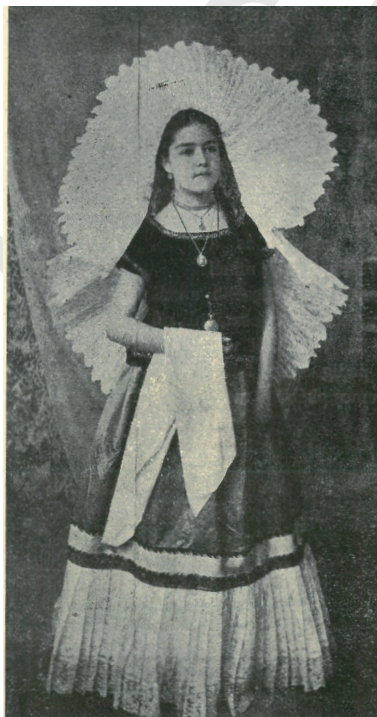
TEHUNTEPEC-I JOBBMÓDÚ MUNKÁSNŐ UTCAI ÖLTÖZETE (MEXIKÓ).