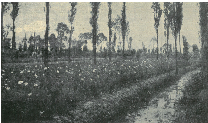
ÚSZÓ KERTEK MEXIKÓ MELLETT (CHINAMPAS).