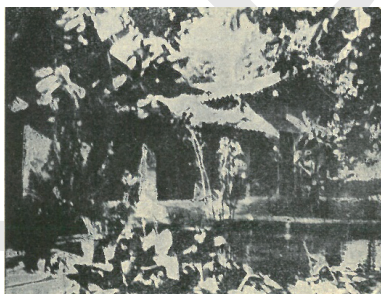
MIKSA CSÁSZÁR HÁZA ACAPANCINGÓBAN.