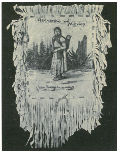
BŐRPÁRNA, BEÉGETETT MUNKA. Indián nő gyermekével.