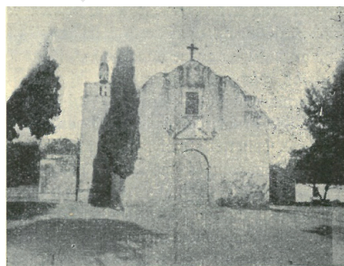
ACAPANCINGÓI TEMPLOM, SZEMBEN MIKSA CSÁSZÁR KAPUJÁVAL.