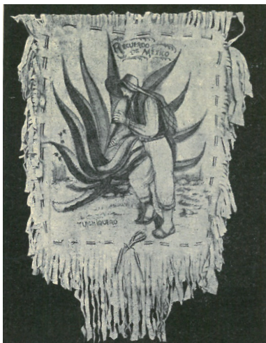
BŐRPÁRNA, BEÉGETETT MUNKA. A pulque ital készítése.