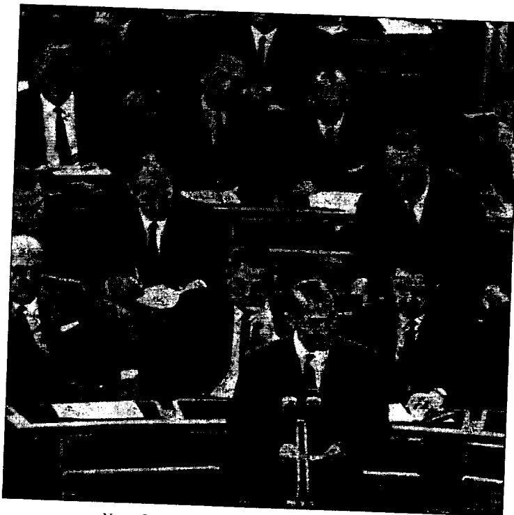
Nyers Rezső az Országgyűlés előtt bejelenti az új gazdasági mechanizmust

XI. A bírói út terjedelme, igénybevételi lehetősége az egyik, ha nem a legfontosabb kérdése volt az 1972-es III. Pp. novella előkészítésének. E kérdéskör egyúttal a hatalom koncentrációjának problémáit vetette fel, s mondhatnánk, politikai rendszertől függetlenül mindig azt veti fel.