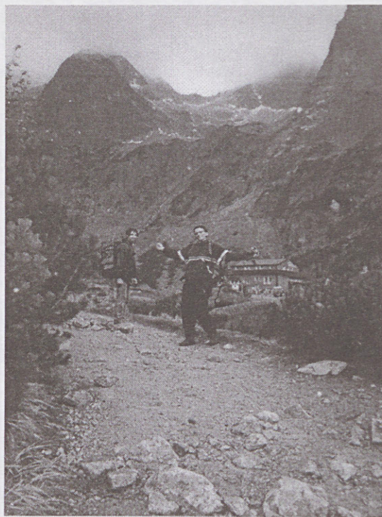
Sanyi végig állt, s dumált kivakarva(?) az álmat a szememből...

Tanár urunk elég hamar feloldódott az események ilyesformán alakult sodrában, s szavaival élve oly volt ez neki, mintha hazatért volna. Végül a szlovák fél unszolására, levetkőzve idegenkedésünket, s a tagjainkban tomboló fáradságot a vacsora után csatlakoztunk a mulatozókhöz. Bár a hely monopol(„rövid ”o“-a szerk.) helyzetéből kifolyólag a kiváló sör igencsak drágán méretett, a kezdeti húzodzkodást a társasági étellel együttjáró anyagi kiadásoktól erőre kapó vendégcsapatunknak sikerült leküzdenie. Így minden sínen, ill. lejtőn volt egy sikeres úri mulatsághoz, bár oroszlánszívű medikustársaimnak jópárszor menekülésre kellett fogniuk a dolgot a csillogó szemű szlovák konyhásnők rémisztő rohamai elől (elég gyenge-a szerk.). Mire a népünnep kezdte volna felvenni egy