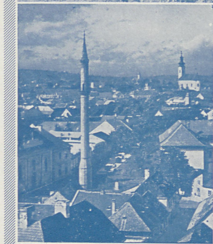
MINARET W EGER