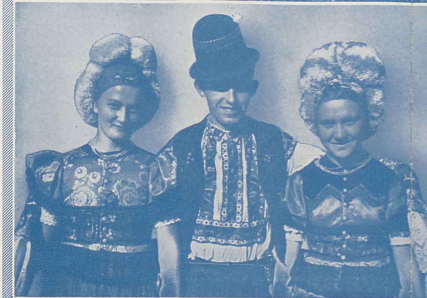
STROJE LUDOWE Z MEZÖKÖVESD