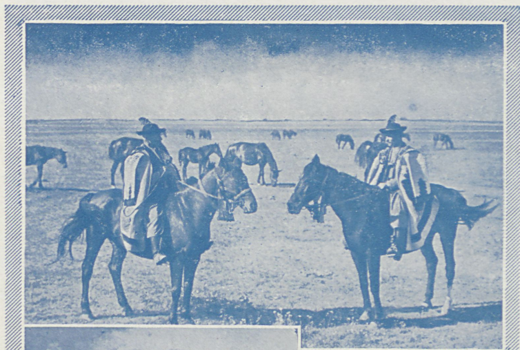
NA STEPIE WĘGERSKIM

Szczegółowe informacje, dotyczące zapisów, warunków uczestnictwa, wykładów i kursów, dyplomów i świadectw oraz kosztów mieszkania, utrzymania i wycieczek, jak również ulg kolejowych itp., zawiera wkładka niniejszego prospektu.