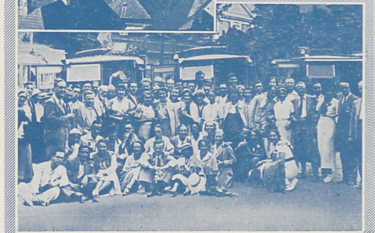
GRUPA UCZESTNIKÓW KURSÓW LETNICH NA WYCIECZCE