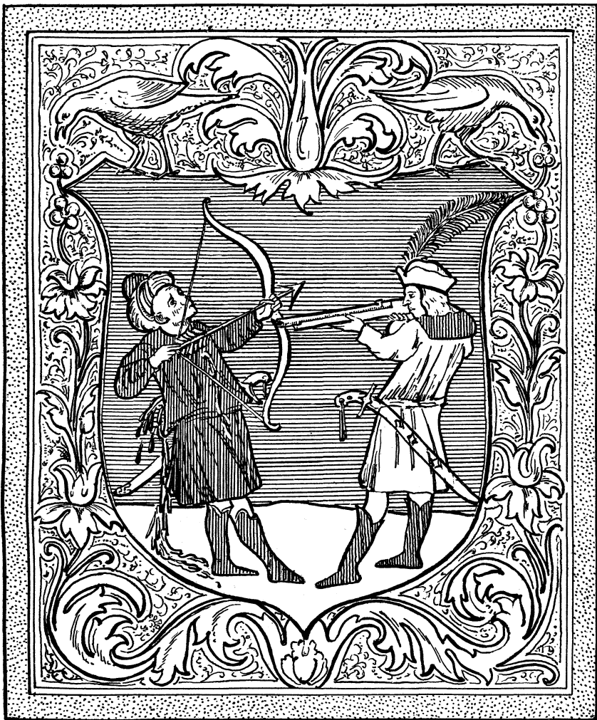
RADÁK CZIMER 1514.