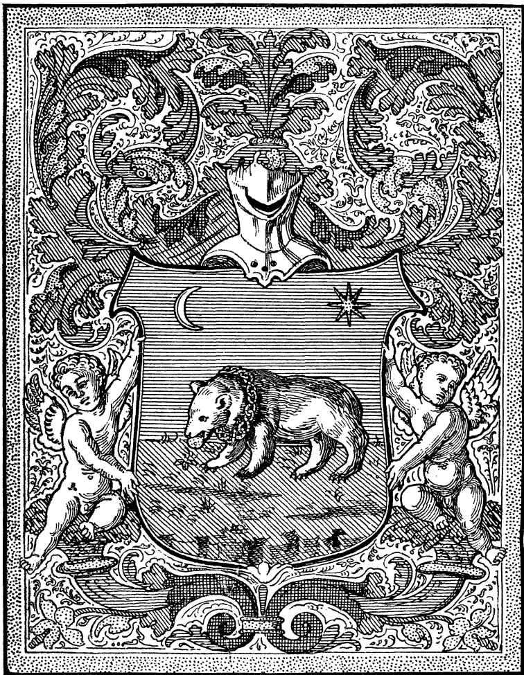
A KÁLLAI CZIMER 1521