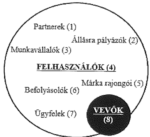
1. ábra: Felhasználók vagy vevők

Forrás: Shapiro (2012) alapján saját szerkesztés Figure 1: Users or Customers Partners(1), Job applicants(2), Workers(3), Users(4), Brand fans(5), Influencers(6), Customers(7), Buyers/consumers(8), Source: own work based on Shapiro (2012)