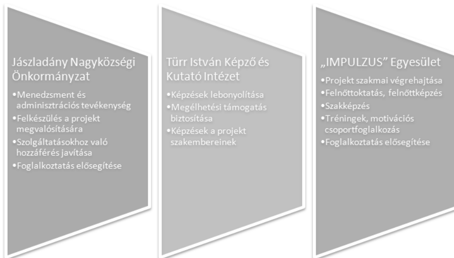
2. ábra: Konzorcium tagjainak feladatkörei

A projekt megvalósítására több mint 140.000.000 forint összegű támogatás állt rendelkezésre, mely megosztásra került a Konzorcium tagjai között annak értelmében, hogy ki milyen feladatokat látott el (Támogatási szerződés, 2014).