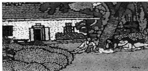
1a. ábra: Rippl-Rónai József „Piknik” c. képe