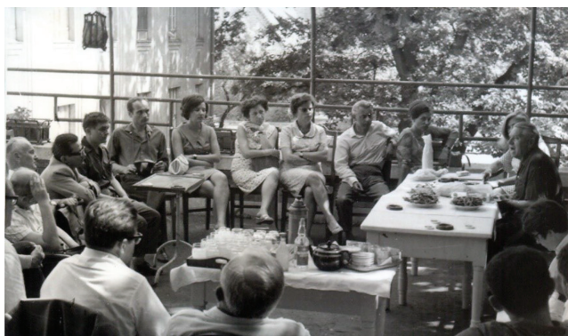
2. ábra | Szövettani konzultáció Szodoray professzorral 1971-ben