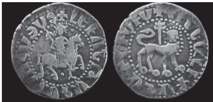
Fig. 5. Silver coin of Leo II (1270-1289)

However, the question emerges: how did they have such accurate knowledge about the Armenian coat of arms and how was the lion pattern accepted as the Armenian royal insignia in the English heraldic tradition? The lion motive had a long career in the Armenian Kingdom. The usage of the lion symbol as a regal signet goes back to Leo I. He was the founder of the Armenian Kingdom and the first king of Armenian Cilicia. On his golden bull appears a standing lion with a crown. 36 This is one of the earliest depictions of the Cilician armorial bearings and it also has a record in England. I discovered a record in an early exchequer inventory: a golden bull of Leo I of Armenia is listed there. 37 This inventory was compiled under the direction of Walter Stapleton, Bishop of Exeter in 1323. Though it is a later compiled inventory but the description demonstrates it stems from Leo I and from his legates: Leuon Regis Ermenye, Bulla aurea signata directa. E. Regi Angi pro nunciis ipsius Rex Ermenie benigne recipiendis . 38 Probably this golden bull was the source of the scribes. It is more conceivable because the seal was available for them at the chancery.