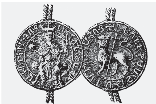
Fig. 3. The Golden Bull of Leo I (1199–1219)

On the one hand, the case of the Armenian coat of arms in the early English armorial rolls is slightly different than previously the Cyprian was, but on the other hand, the situation of the Armenian Kingdom and the Kingdom of Cyprus are quite similar. In the following chapter I examine the description variants of the Armenian coat of arms in chronological order and also explain the distinctions and the similarities.