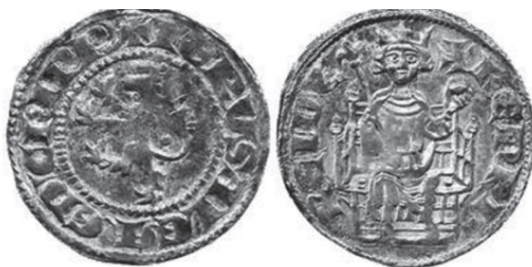
Fig. 1. The Gros of Henry II (1285-1324)