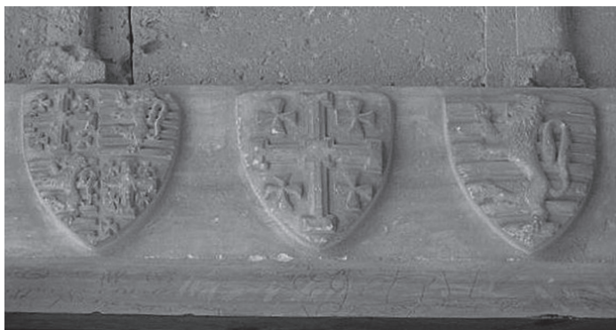
Fig. 2. The Coat of Arms of Henry IV (1324–1359) in Bellapais Abbey

Considering all these statements that developed through the analysis, we find an arresting situation. Chronologically, the last English armorial roll based on the French reference source brings a proper description, in addition only one roll describes it according to reality, the Herald's roll. We already know that the copyist of the Camden Roll possibly made a mistake during the compilation. It also starts to stand out that the scribe of Segar roll did not work from the standard textual tradition, but from his own knowledge, which was deficient regarding the coat of arms of Cyprus. In the case of Walford's roll, we have seen that the scribe did not know the shield of the Lusignans. Therefore, he created one based on the coat of arms of Constantinople.