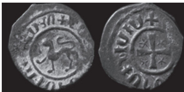
Fig. 4. Copper coin of Leo II (1270-1289)

The description in the Herald's Roll is different. According to the blazon, the coat of arms of the Armenian king is a red cross charged at the fess point with a gold crown. It is notable and important that the blazon does not say anything about the field tincture. The scribe of the Camden Roll took over accurately the description of the Herald's Roll, and he also added the missing field tincture. In the Camden Roll the above described cross and the crown are in an ermine field. Possibly, the explanation of this fictitious field solution is that the compiler of the Camden Roll did not know the Armenian coat of arms at all, but he noticed the missing element of the blazon while copying. He completed the description with the missing data. It was an allusive element: the word ermine. According to the scribe of the Camden roll the coat of arms of Armenia was a crowned cross in an ermined field. The canting arms or arms perlantes were not rare at that time, some of the royal bearings are also represented in this category. 33 The jingle of the words king of Ermyne and the field tincture ermine is clear. This solution was not peculiar, the usage of the canting arms and its usage to replenish the missing data were accepted.