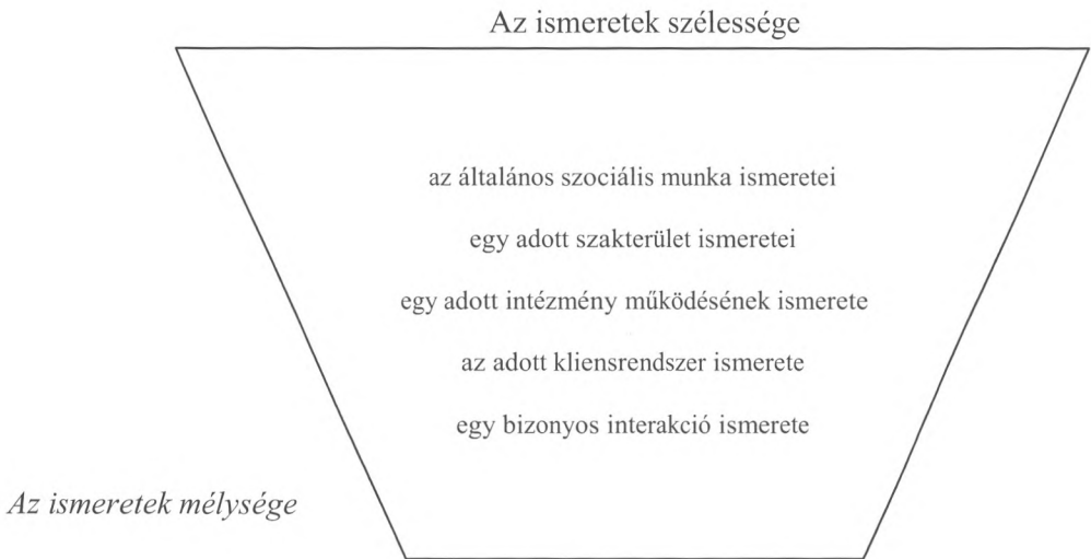
2. ábra. Morales és Sheafor ismeretelméleti sémája (Morales–Sheafor 1989: 109)

Minél szélesebb egy adott ismeretrendszer, annál többféle ismeret tartozik az adott szinthez. Az általános szociális munkában számos dologgal tisztában kell lennünk, a céloktól az eszközökig, az elvektől az értékekig bezárólag, ám ezek olyan kérdések, amelyekkel hosszabb-rövidebb könyvek sora foglalkozik. A gyakorlatban tevékenykedő szakembereknek olyan mélységben szükséges ismerni e kérdésköröket, amely lehetővé teszi a kellően hatásos és hatékony munkavégzést. A példa kedvéért szükséges megismerni a szociális munka mibenlétét, lényegét, ám szükségtelen ismernünk valamennyi szociális munka meghatározást, amelyből bizony akár több száz létezhet a világban.