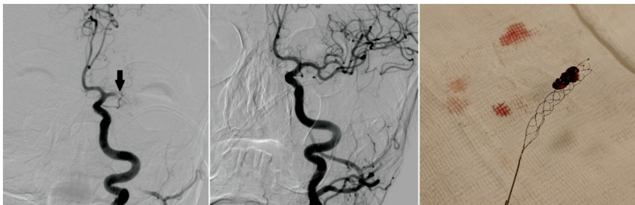
3. ábra | Bal oldali a. cerebri media M1-szakasza elzáródásának (nyíl) angiográfiás képe, mellette a sikeres revascularisatio utáni megnyílt érrendszer. Fényképen a kihúzott sztentretriever és a rajta lévő thrombus

Az egyéb intracranialis műtéti beavatkozásokkal ellentétben – amelyeknél szükségszerű követelmény a teljes mozdulatlanság és az intratrachealis narkózis – az endo-