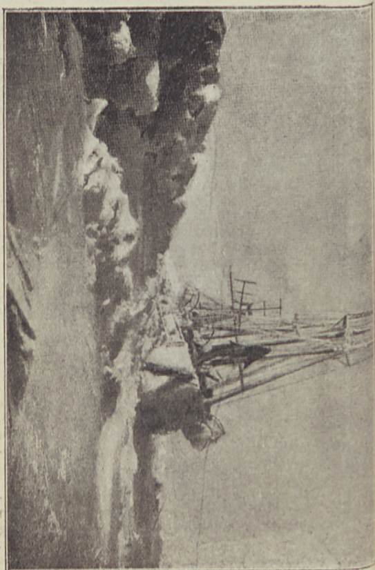
A „Fram“ holdvilágánál az 1895. januáriusi erős jégtorlódás után.