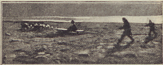
Az első kísérlet a kutyaszánnal.

Mivel hajónkon az üst kijavítása még mindig nem volt készen, még egyszer kimentünk a szárazra, hogy a kutyák szánhúzó képességét kipróbáljuk. Trontheim tizet kiválasztott és egy sza-