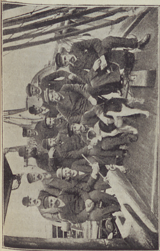
A norvég sark-expediczio tagjai.