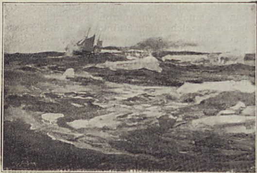
A „Fram“ a Kari-tengerben.

Mivel az üstbe vizet kellett merítenünk, a sziget mellett leeresztettük a vasmacskákat; nehá-