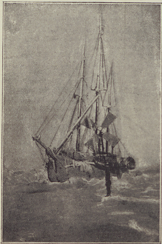
Tavaszkor kezdete. (1894. április.)