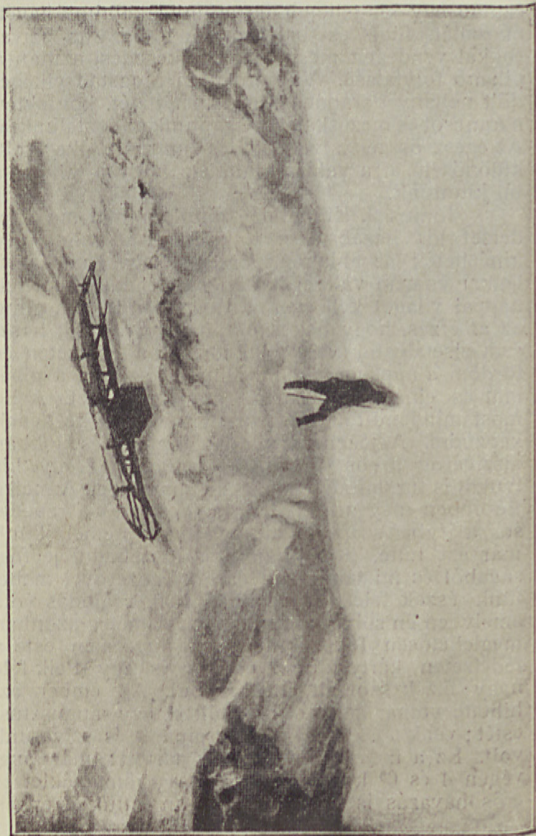
Az úszó jég nyáron (1894. júl. 21.)