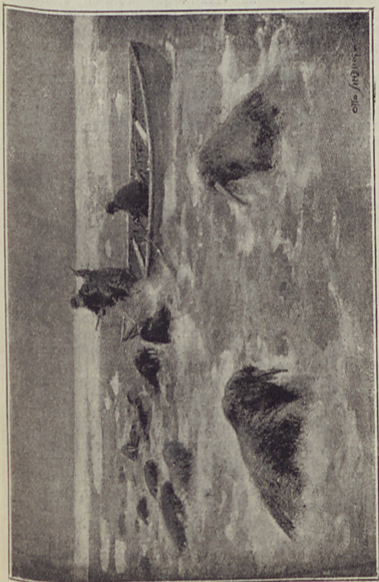
Rozmár-vadászat a Tajmir-félsziget keleti partján.