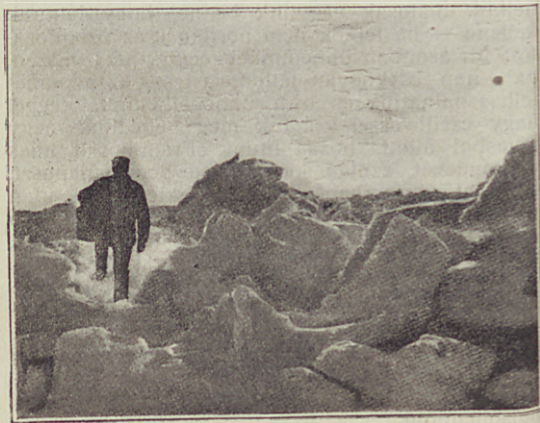
Összetorlódott jég a „Fram“ közelében.

Az április hónap a természet barátjának mennyi új, kiapadhatatlan gyönyörűséget okoz! De itt — itt mindebből semmi sincs. A nap ugyan ragyog, ragyog sokáig, de sugarai nem esnek erdőre, sem rétre, sem hegyre, hanem a friss hó fehér leplére. Alig tud téli menedékhelyünkben kialsalni. Az április itt nem okoz átalakulásokat. A