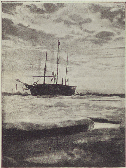
Egy nyári est.

életben haladunk előre és soha visszafelé nem megyünk. Mindnyájan megható figyelmességet ta-