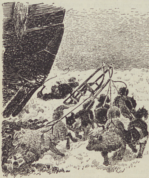
Első önálló szánútam.

Igy folyt tovább a játék, míg valószínűleg ők maguk meg nem unták és azt gondolták, hogy változatosság kedvéért egyszer mehetnének azon