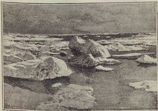
Az első jég.

megkezdettük, saját testünknek is egy utolsó civilizált tisztító ünnepre volt szüksége. A városi fürdőház alacsony; belsejében padokkal van el látva. Mialatt az ember ezek egyikén fekszik, forró gőzökben fő, amit folytonosan megújítanak, amennyiben egy pokoli módra megtüzesített kályhat minduntalan leöntenek vízzel. E közben a fürdővendéget fiatal lányok eleinte hajlékony vesszők-