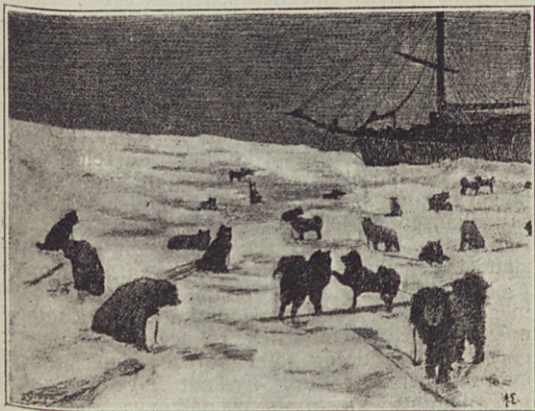
Kutya-tanyánk a jégen.

és üressé lesz. Ez esetben mire való ez a szépség, ha nincs teremtmény, amely benne gyönyörködhetnék? Most kezdem érteni. Ez a jövődöbéli föld — itt egyesül a szépség a halállal. De mi célból? Mit jelentsenek mindez égi testek? Olvassátok le a feleletet, ha tudjátok, a csillagos égboltozatról.