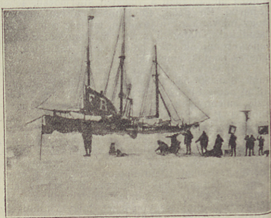
A május 17-iki ünnep (1894.)

A szél süvöltött és a norvég lobogó erősen