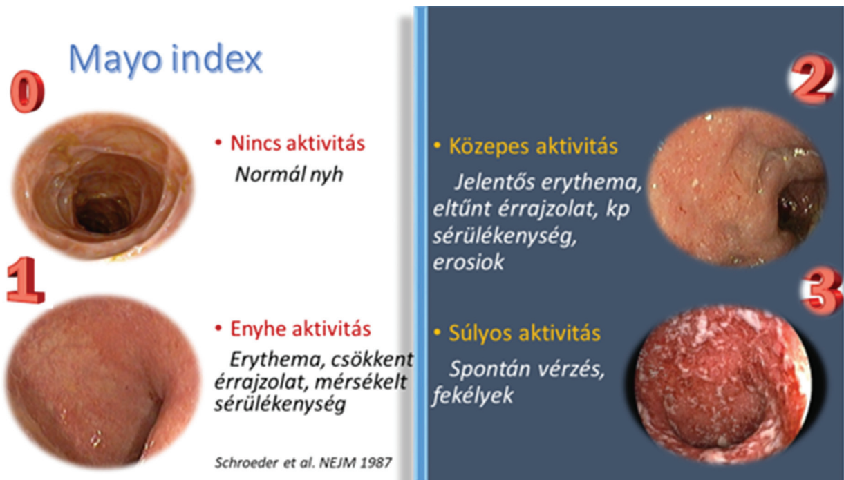
1. ábra | A colitis ulcerosa Mayo endoszkópos indexe [12]