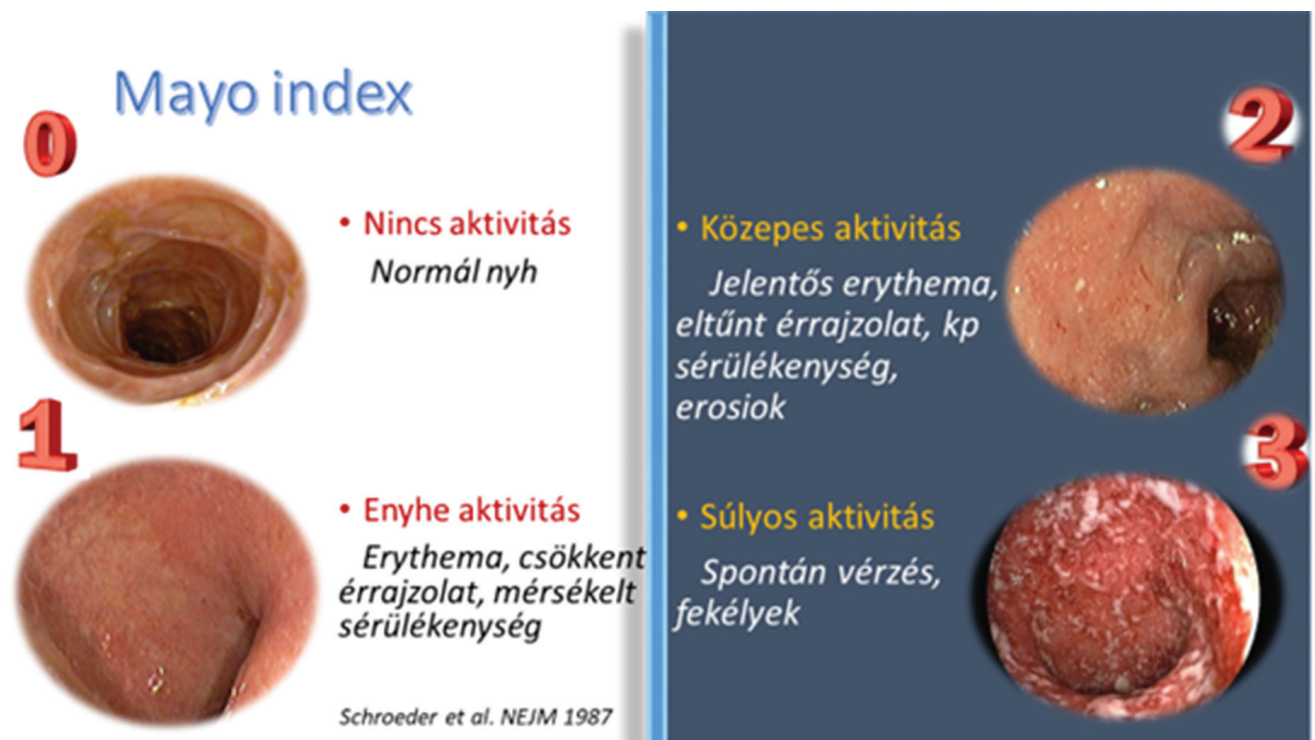
1. ábra | A colitis ulcerosa Mayo endoszkópos indexe [12]

ban a két leggyakrabban alkalmazott endoszkópos index a Mayo pontrendszer endoszkópos része (1. ábra) [itt érdemes szegmenstenként pontozni az aktivitást, hogy a kiterjedés megítélhető legyen: ascendens, transversum, descendens, sigma és rectum] illetve a UCEIS (Ulcerative Colitis Endoscopic Index of Severity), mely az érrajzolatot, a vérzés fokát és a fekélyek típusát értékeli (3. táblázat). Jobban korrelál a betegség aktuális súlyosságával, jobb az intra- és interobserver egyetértés (0,96; 0,88 vs 0,73; 0,51 Mayo) és \geq 7 értéknél a klinikai felvételnél szoros korrelációt mutatott a későbbi IFX vagy CyA igénnyel. Mindkét index szorosan korrelál a széklet calprotectin és a „Patient Reported Outcome – PRO” értékével [13].