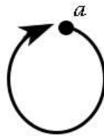
1. ábra. Tudat (a) mint monoid. A nyíl az identitás morfizmust jelképezi.

Most visszatérek az ortogonalitás kérdéséhez. Az agy térbeli adatkompressziója egy ortogonális érzékszervi időbeli hologramot hoz létre (Saaty és Vargas, 2017), amely egy ortogonális vetületet jelent a kétdimenziós kortikális felületre (Déli, 2020a,b). Az idegtudományban a hippocampus térsejtjei a térbeli kapcsolatokat időbeli vetületté alakítják (Shimazaki, 2020), ahol a köztes hippocampus CA1 a térbeli aspektusokat, míg a dorsalis hippocampus CA1 az epizodikus emlékek időbeli aspektusait szolgálja, és koordinálja a kollektív viselkedést.