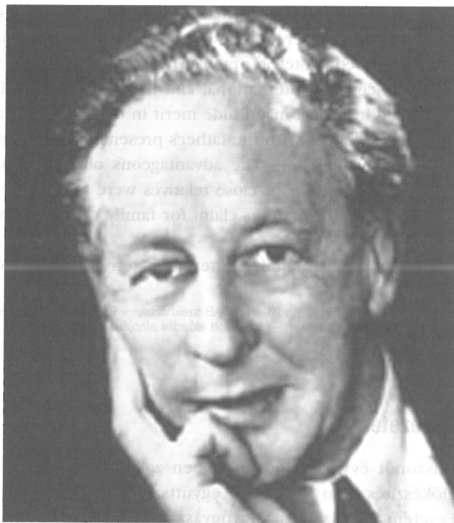
1. ábra G. Dick-Read

Ennek a gyakorlatnak az első – és alapvető – mozzanata az együttes, közös felkészülés a szülésre. Ehhez csatlakozik a partner, a közeli hozzátartozó jelenléte a szülésnél. A napjainkban világszerte elterjedt felkészítő módszerek kialakításában két szülész-nőgyógyász szerzett elvülhetetlen érdemeket: az angol Grantly Dick-Read és a francia Fernand Lamaze.