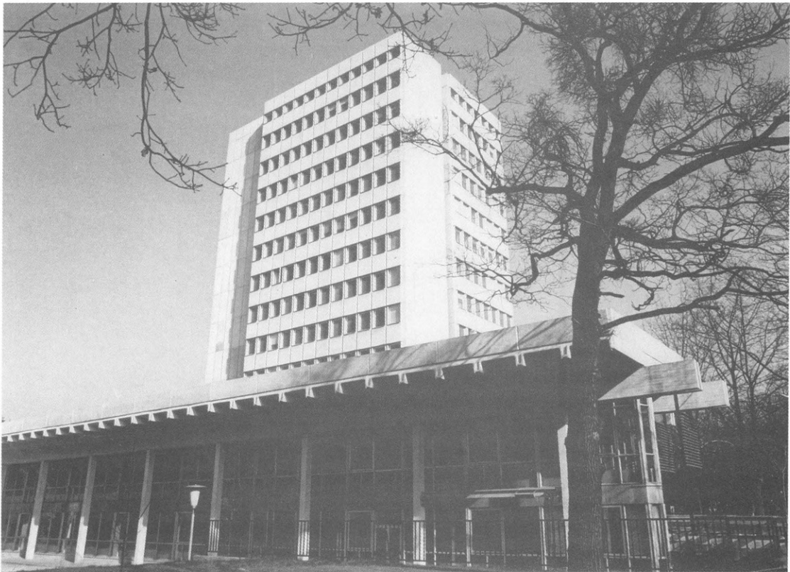
A megvalósult kész épület 1973. augusztus.