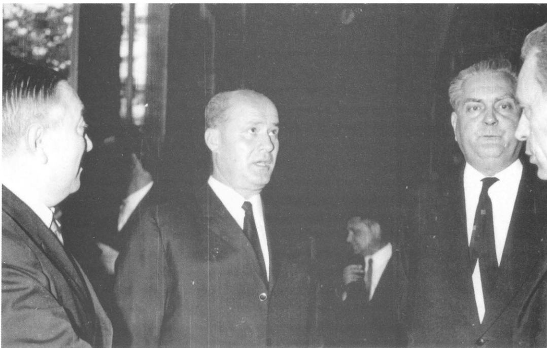
Losonczi Pál a Magyar Népköztársaság Elnöki Tanácsának Elnöke látogatása az egyetemen a KLTE kitüntetéses avatásán 1970. Balról jobbra: Rapcsák Ferenc a KLTE rektora, középen Losonczi Pál, Kesztyűs Lóránd és Bolodár Alajos