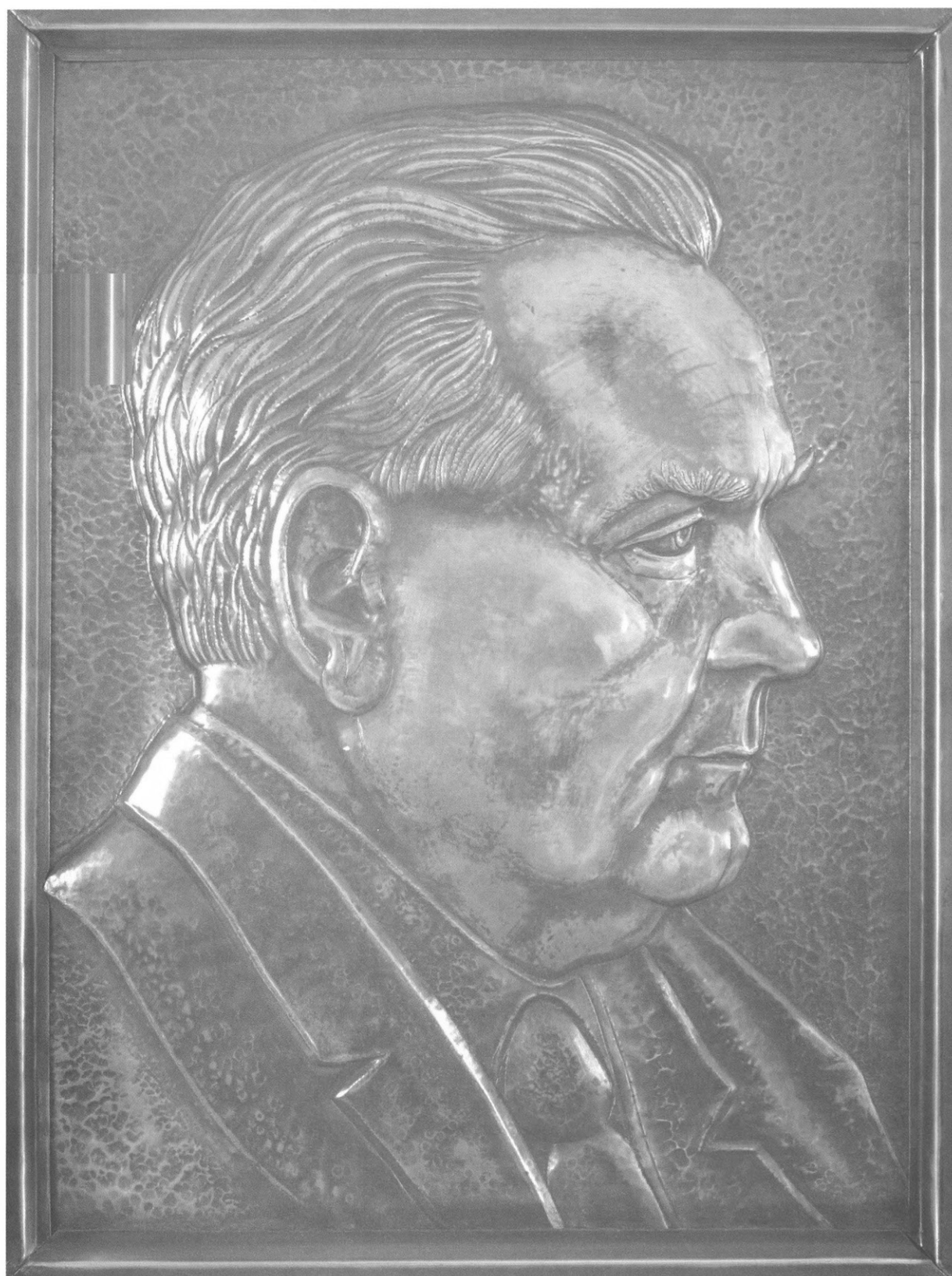
Rézdombormű: Prím Zoltán ötvösmester műve