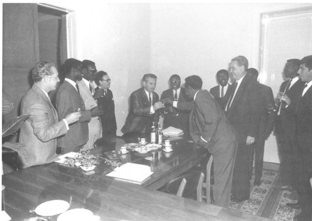
Külföldi diákok fogadás a DOTE rektori hivatalban 1971.