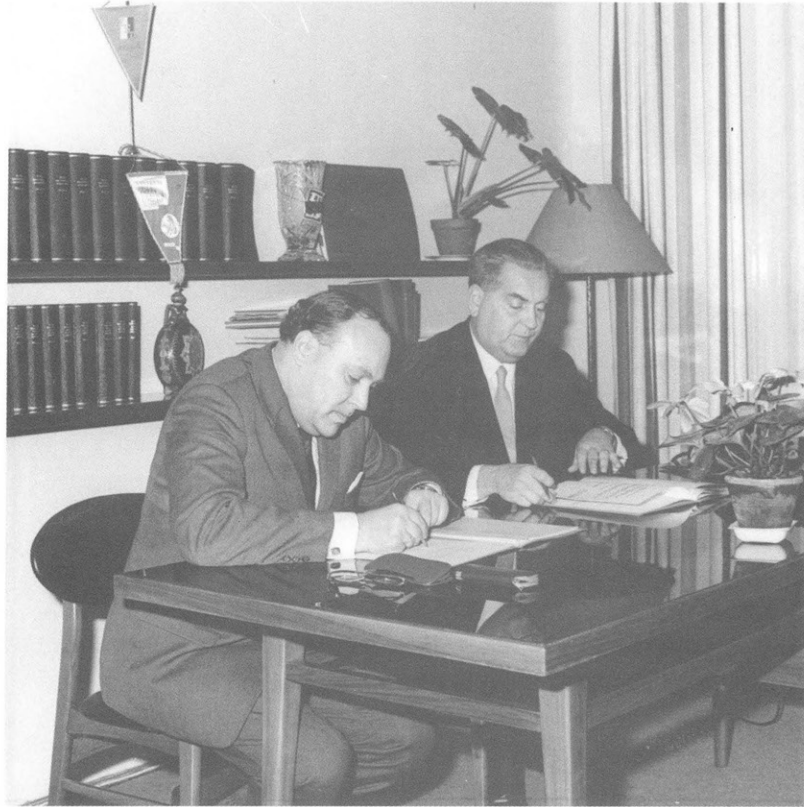
A Rostocki Egyetem és a DOTE közötti szerződés aláírása 1970.