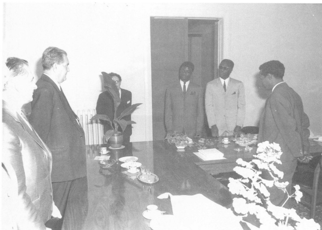
Külföldi (de a DOTE-n tanuló) diákok üdvözlik Kesztyűs Lóránd rektort 1971.