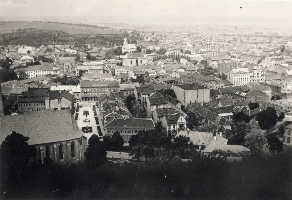
1. ábra. Kilátás az Avasról 1937-ben. Balra az Avasi Református Templom, alatta az Erzsébet tér és szemben a Korona Szálló.

belül hetvenhat 13 életveszélyes épületet azonosítottak be a helyszínek feltüntetése nélkül, amely árnyalja Miskolc épített környezetének helyzetét az időszakban – ekkor, az 1930-as évek elején Miskolchoz még nem csatolták hozzá a környező településeket, így feltehetően a Tetemvár vagy az Avas környékén voltak nagyobb számban ezek az épületek.