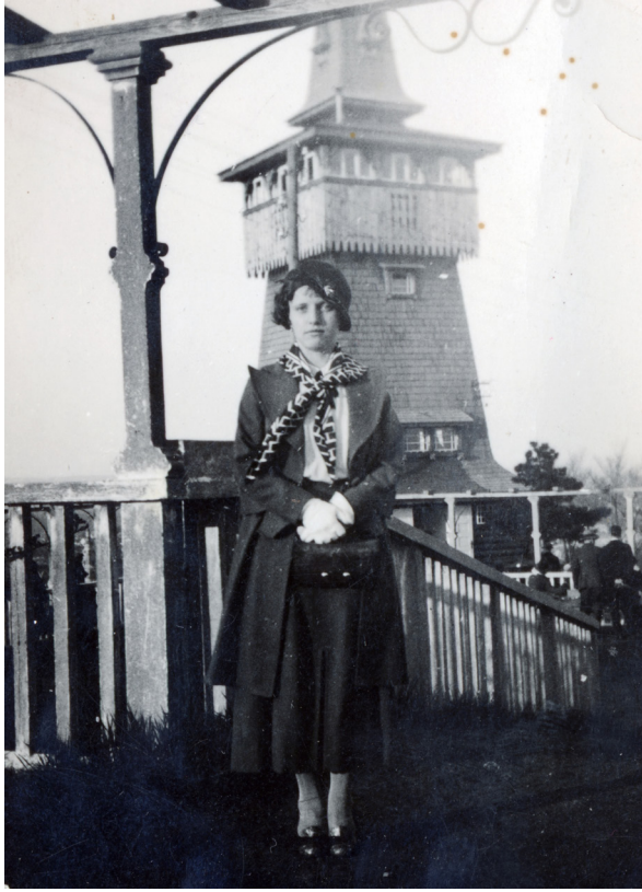
3. ábra. Az avasi Rákóczi-kilátó 1935-ben.