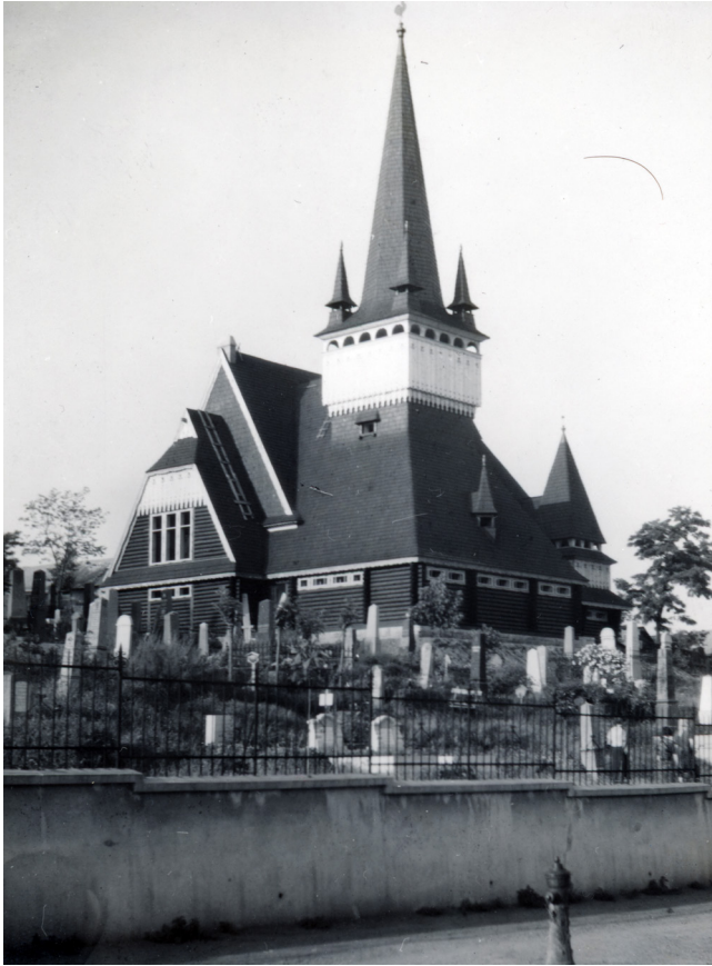
4. ábra. Deszkatemplom 1939-ben.

tőjének megbízására készítette el a tavi gyógyfürdőt, a melegvízű tó közepére megépült fürdő-épületet, amelynek átadására 1941-ben került sor. [...] Ahogy Menner László kör alakú nyári fedett étterme esetében is megjelent a magyaros stílus, Szeghalmy tervében is központi szerepet kapott, és a kabinokat erdélyi magyaros motívumú virágdíszekkel ékesítették” (5. ábra). 96