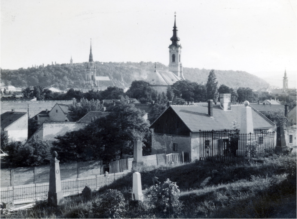
6. ábra. Tetemvár felsősor, kilátás a Deszkatemetőtől 1939-ben, távolban az avasi Rákóczi-kilátó.