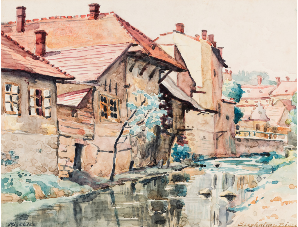
2. ábra. Szeghalmy Bálint: Szinva-parti házak, 1929 (akvarell, papír 24×31,5 cm).

Herman Ottó Múzeum, Képzőművészeti Gyűjtemény. Ltsz.: HOM KGy 53.131.1.