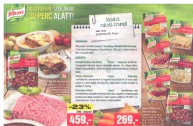
Interspár újságban Mexikói rakott krumpli receptje (2014)

A táplálkozáskultúra vizsgálata során – amennyiben lehet – fel kell tárni egy községben vagy az egymás közelében élő különböző népcsoportok egymásra hatását. Az 1970-es évekig a legjellemzőbb egymásra hatás általában úgy történt, hogy a szegényebb követte a módosabbat. További jellemző még hogy a községbe beköltözött vagy a munkára rendszeresen eljáró alanyok közvetítettek új ételalapanyagokat és ételféleségeket. Ezek új ízeket eredményeztek. Szintén az átadás alkalmi a közös munkaalkalmak, ünnepi sütés-főzés. Megállapítható, hogy az újdonságok átvételének közvetítői a közösségből (faluból) eljárók. Az eljárók (ingázók) lehettek fiatal munkába járó férfiak-nők, iskolás lányok.