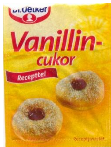
Vaniliás cukroscacskón „vaniliás fánk”-recept