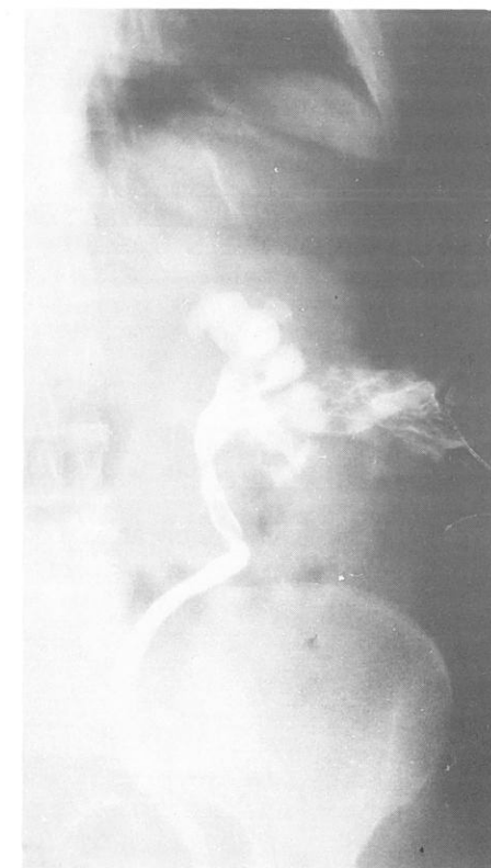
3. ábra. Öt perccel a TD lezárása után megismételt töltés

bunculust találtunk. A hilus képleteinek kiperparálása közben a vena renalisra lévő perforációs nyílás az alvadékoktól szabaddá vált, és ismét jelentős vérzés indult meg. Tekintettel a beteg sokkos állapotára, a gennyes vesegyulladásra nephrectomia mellett döntöttünk. Eseménytelen posztoperatív szak után a beteg gyógyultan távozott.