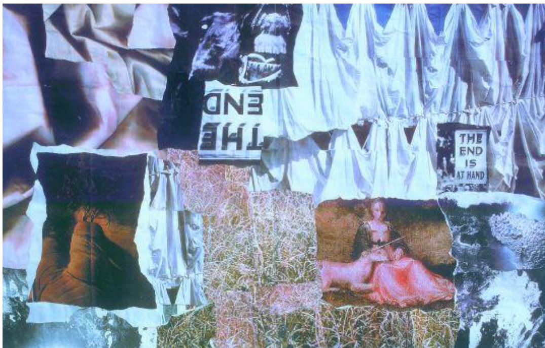
Dús László kollázsa

Ezek a motívumok azonban csak megalapozták a helyesen végrehajtott öngyilkosságot, de maga a tett is meg kellett, hogy feleljen néhány szabálynak ahhoz, hogy a társadalmi környezet helyeselje a végleg eltávozó cselekedetét. A döntés nyugodt, racionális kellett, hogy legyen. Természetesen lehetett érzelmileg befolyásolt, de a higgadságnak kellett meghatározónak lennie. További fontos feltétel volt a tett nyilvános végbevitel. Előzőleg a halálba menő beszédet tartott hozzátartozói előtt, amelyben megindokolta döntését, vigasztalta őket, és tanácsokat adott a jövőre vonatkozóan.