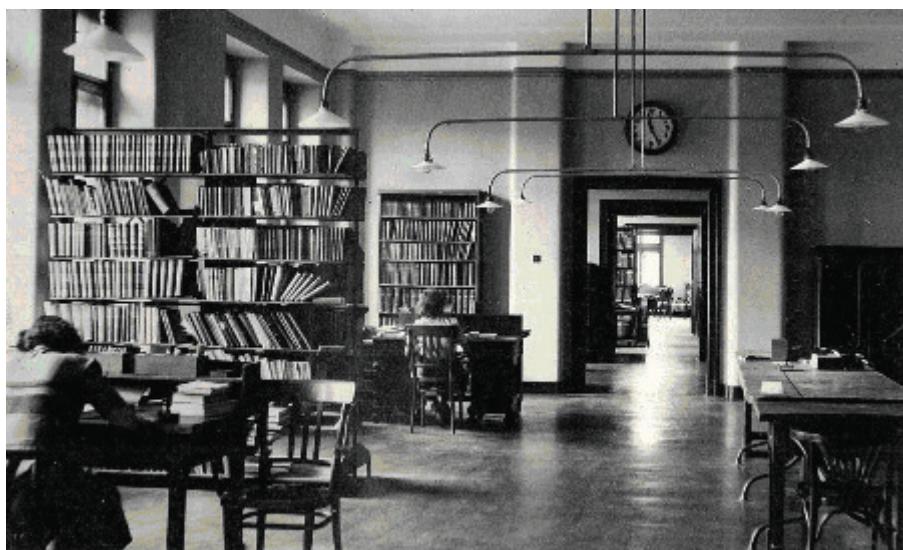
Munkaszobák, háttérben az igazgatói iroda, 1950-es évek.