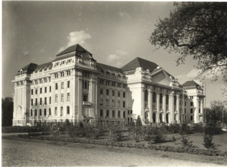
Az Egyetem Központi épületének Nyugati oldala, 1932-ben.