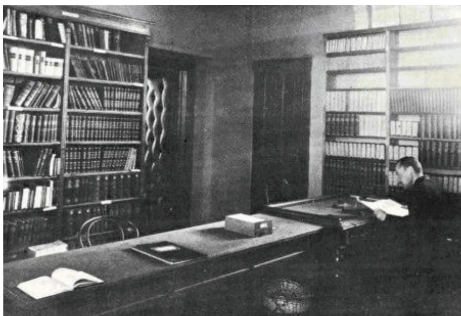
Az Egyetemi Könyvtár első Olvasóterme a Simonffy u. 2. szám alatt.

VÉRTESY Miklós: Terveiből kevés valósult meg, de így is sokat tett. Beszélgetés Nyíreő Istvánnal = A Könyvtáros 27. évf. 7. szám 1977. július 393–396.