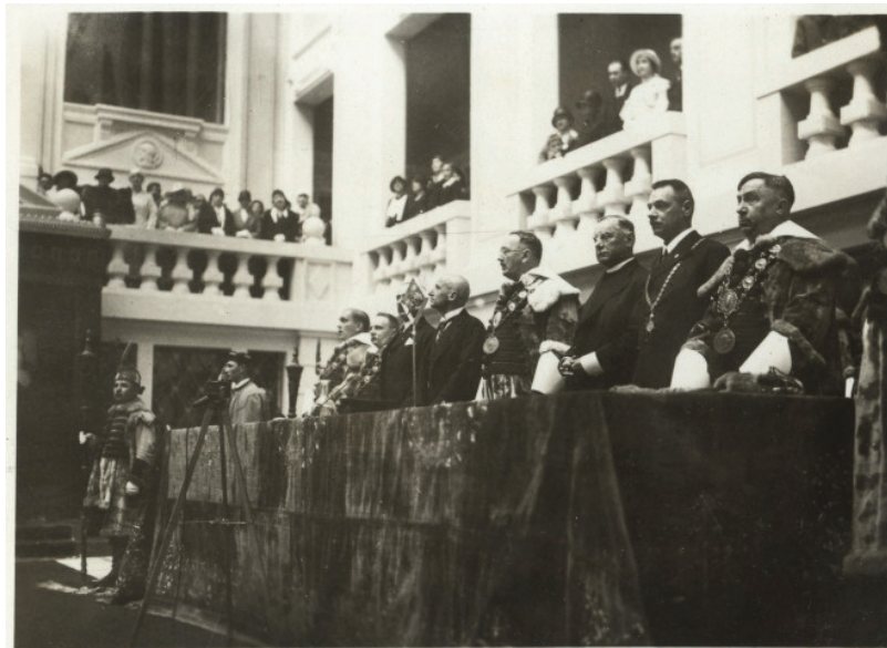
Az Egyetemi Tanács tagjai Szily Kálmán államtitkárral a Központi épület megnyitó ünnepélyén, 1932. május 15-én.