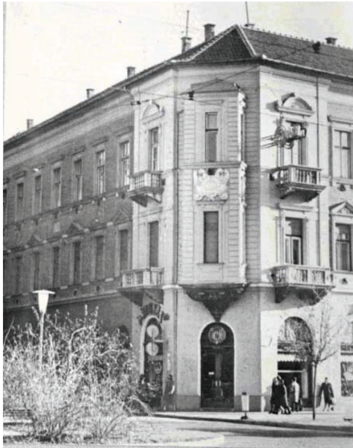
Debrecen Város tulajdonát képező Simonffy u. 2. számú bérház második emeletén volt az Egyetemi Könyvtár első otthona, 1916-tól 1932-ig

u. 2/b – 2/c. számú bérház 2. emeletén. A néhány évre tervezett ideiglenes elhelyezésből pedig majd 15 éves Simonffy utcai bérlet lett.