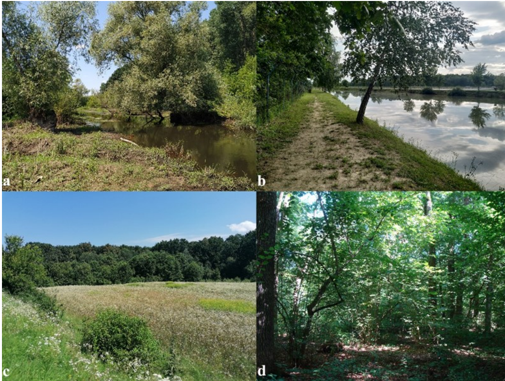
2. ábra. A mintavételi területen található élőhelyek: a = Szernye-csatorna, b = halastó, c = rét és ártéri erdő, d = ártéri erdő

Figure 2. Habitats of the sampling area: a = Szernye-channel, b = fishing lake, c = meadow and floodplain forest, d = floodplain forest