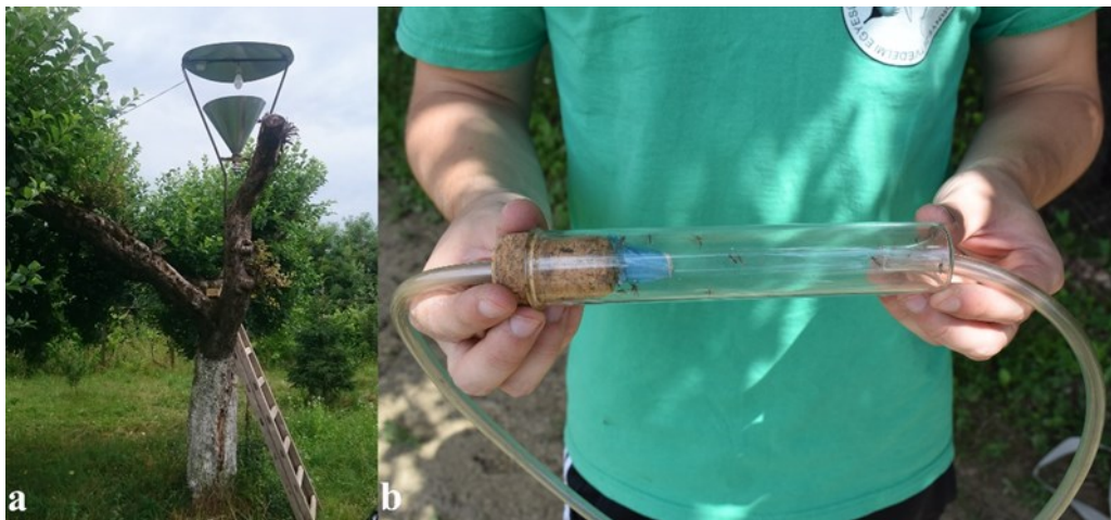
3. ábra. Alkalmazott mintavételi módszerek: a = fénycsapda, b = rovorszippantó Figure 3. Used sampling methods: a = light trap, b. insect aspirator

rovorszippantós módszerrel, 2020-ban 10 faj előfordulását tudtuk kimutatni.