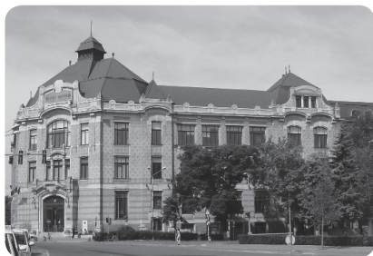
Kolozsvári Egyetemi Könyvtár