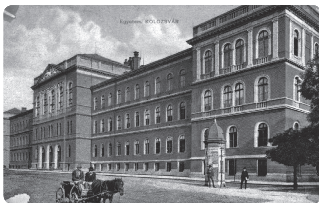
Kolozsvár, Ferenc József Tudományegyetem Központi Épülete