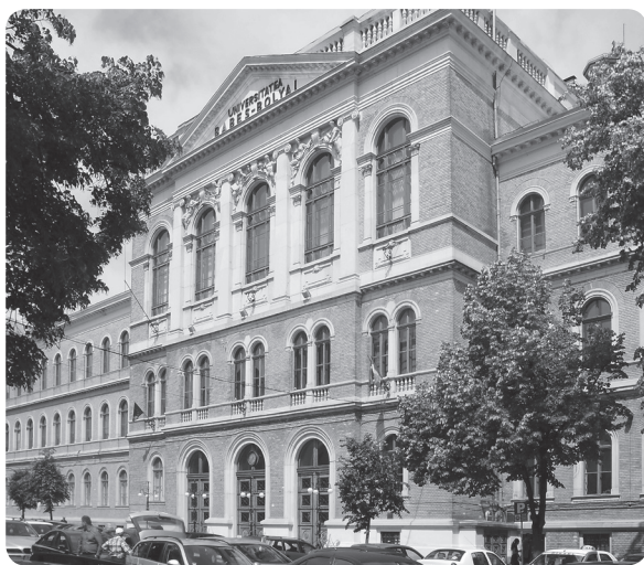
A Babeș-Bolyai Tudományegyetem főépülete

De ezt sem lehet biztosan állítani, mivel úgy 1919-ben, mind 1945-ben nem teljesen alaptalanul aggódtak, féltek a románok az estlegesen helyben maradó magyar orvosi fakultás okozta versenyhelyzettől (elsősorban a klinikák tekintetében). Itt kell