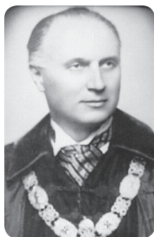
Miskolczi Dezső (Baja, 1894. – Budapest, 1978.)

tagjának választották meg 1945-ben, de még ugyanebben az évben nyugdíjazták, majd akadémiai tagságát visszaminősítve kiszorult a tudományos- és közéletből.