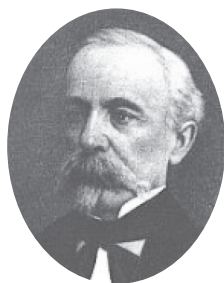
Berde Áron (Laborfalva, 1819. – Kolozsvár, 1892.)

Magyar jogász, közgazdász, egyetemi tanár, a Magyar Tudományos Akadémia tagja, az első magyar meteorológiai és klimatológiai szakkönyv szerzője, a Kolozsvári Tudományegyetem első rektora.