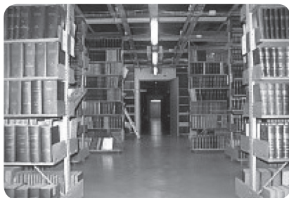
Kolozsvári Egyetemi Könyvtár gyűjteménye