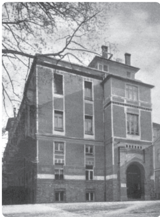
Állattani és Összehasonlító Bonctani Intézet (Apáthy Intézet)

A különálló Ideg- és Elmegyógyászati Klinika számára egy 28 000 m 2 -es telket vásároltak, s az épület 1903 végéig készült el, lezárva a klinikai építkezések korszakát (1897–1903). Az egyetemi építkezések azonban tovább folytatódtak, és 1907–08 között készült el Apáthy István, a zseniális tudós méltán híres Állattani és Összehasonlító