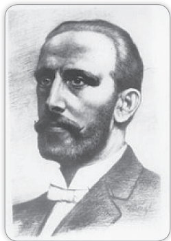
Apáthy István (1863–1922)

A Nagy Háború során 3661 hallgató vonult be katonának. A hősi halottak száma 193 (5,27%) volt. A klinikai ágyak számát a háború alatt 1500-ra emelték (kb. 10%), és a klinikák hadikórházként működtek.