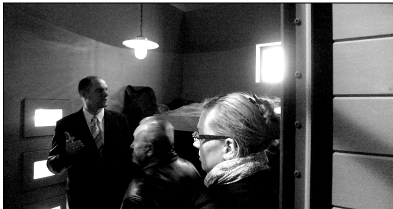
A „Kítaszítottak” kiállítás megnyitója, Hajdúnánás, 2011. november 3.

A XX. század derekának viharos évtizedei Hajdúnánás történelmében jelentős megpróbáltatásokkal jártak. Az események megismerése és megértése, a múlttal való szembenézés, a polgári áldozatokról történő megemlékezés, a történelmi igazságtétel mind-mind hozzájárulhat a tragédiák feldolgozásához. A város életében bekövetkezett sorsfordulókat, az egyre távolabbi múlt homályába vesző történéseket ez az interaktív kiállítás egyértelműen közelebb hozza a város lakóihoz, valamint a történelmi múlt iránt érdeklődő szélesebb nagyközönséghez. A korszak példátlan mértékű változásokkal járó történelmének alaposabb megismertetésével, és a sokak számára még személyes történelemként élő múlt hiteles, eredeti forrásokon alapuló bemutatásával az egyéni, illetve családi sorstragédiák háttérében megbúvó mélyebb történeti összefüggések is könnyebben megérthetők.