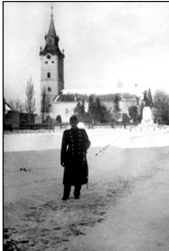
Katona fotója Hajdúnánás főterén, 1940-es évek

Hajdúnánás XX. századi történelme tele volt megpróbáltatásokkal. Érintette a város lakóit a holocaust, az igen jelentős hajdúnánási zsidó közösség elleni szervezett állami fellépés, a helyi zsidók gettókba zárása és deportálása az 1940-es évek derekán. A második világháború végén a kivonuló német csapatok nyomában járó Vörös Hadsereg brutális fellépése okozott máig feldolgozatlan traumákat, a