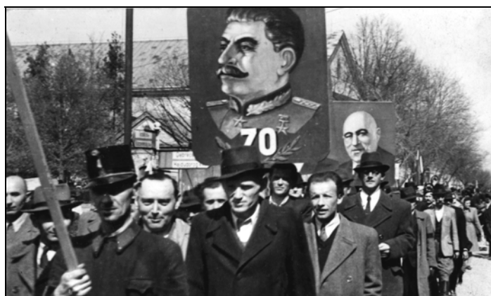
Felvonulás Hajdúnánáson, 1949. április 4-én