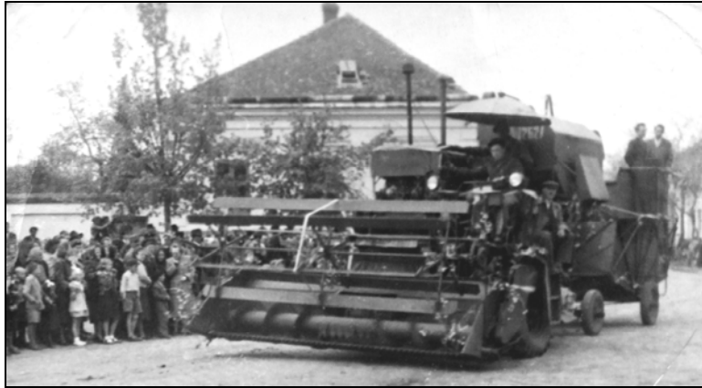
Mezőgazdasági betakarítógép (kombajn) április 4-i felvonuláson. Hajdúnánás, 1960-as évek eleje