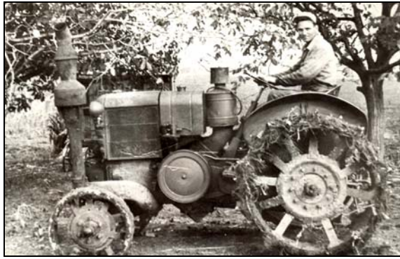
Körmös traktor. Hajdúnánás, 1950-es évek

1949. december 21-én, Sztálin születésnapján született meg a December 21, 1950. február 25-én a Micsurin és 1950 őszén a Táncsics Tsz, 1949-ben alakult a Dózsa Tsz és a Haladás Tsz. Az 1950-es évek elején újabb termelőszövetkezetek keltek életre, 1952-ben szerveződött a Petőfi és a Kossuth Tsz, és 1955-ben alakult meg a Szikra. 39 A hajdúnánási termelőszövetkezeti rendszer a város mellett, Tedejen működő állami gazdasággal egészült ki, ahol 1951 és 1953 között kényszermunkatáborot működtettek.