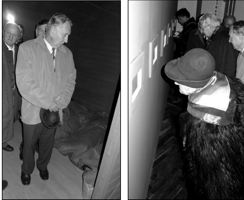
A „Kitaszítottak” kiállítás megnyitója, Hajdúnánás, 2011. november 3.

a korszerű világ- és európai trendekhez igazodó ábrázolásmód szerencsés találkozása jelenti a siker zálogát. A kiállítás témájául szolgáló események, a helyi társadalmat ért és máig is feldolgozatlan tragédiák sora annak a bizonyosága, hogy a „Kitaszítottak” című tárlat megvalósítása nemcsak időszerű volt, de létrehozásával több mint két évtizedes adósságot törlesztettünk.