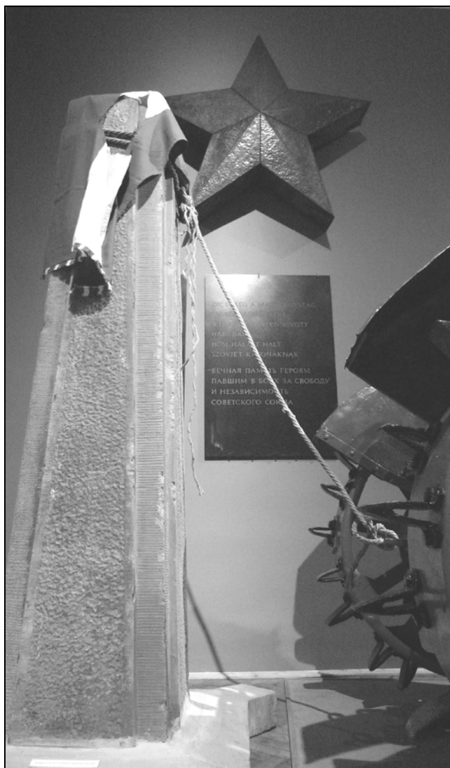
„Kítaszítottak” kiállítás, Hajdúnánás, 2011.