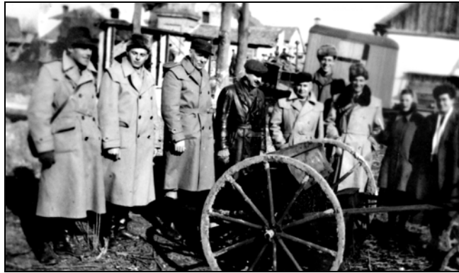
Tsz tagok egy vetőgépet állnak körbe, Hajdúnánás, 1950-es évek

Igaz ugyan, hogy az Alföldön hagyományosan jóval apróbb birtokok alakultak ki és a nagybirtokok túlsúlya főként a Dunántúltra volt jellemző, de a földosztás során itt is jelentősen átalakult a birtokstruktúra. Tekintve, hogy az igényjogosultak nagy száma mellett nem volt elegendő a kiosztható föld, nem egy esetben visszaélések és jogtalan földfoglalások is történtek.