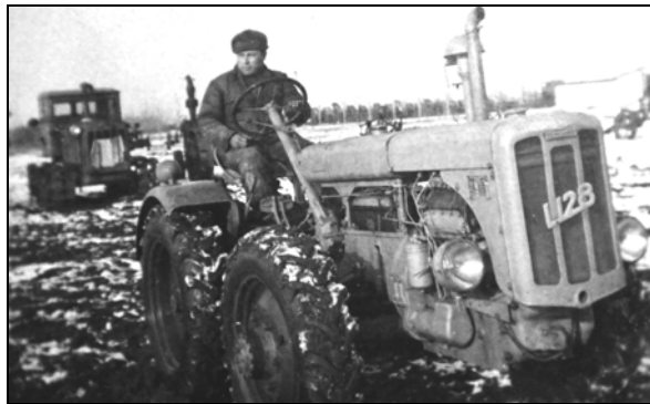
Mezőgazdasági munkák. Hajdúnánás, 1960-as évek