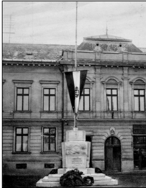
Hajdúnánás Országzászló, 1940-es évek

forradalmárok ellen, és noha senkit sem végeztek ki, a több éves börtönbüntetés kiszabása gyakorinak tekinthető.