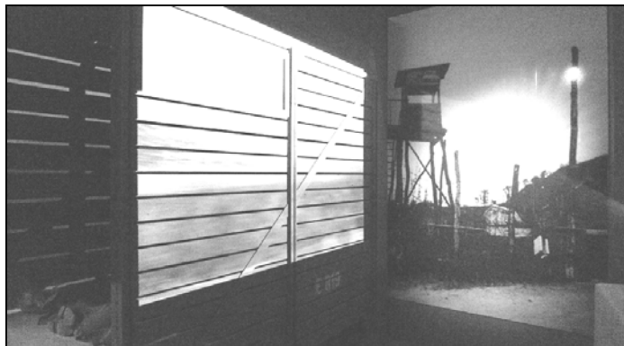
„Kitaszítottak” kiállítás, Hajdúnánás, 2011.