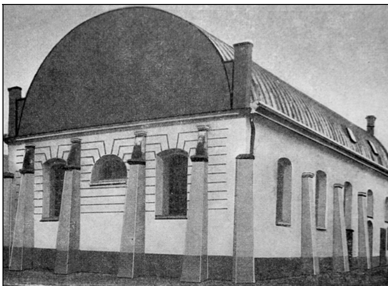
A hajdúnánási zsinagóga egykori épülete, 1940-es évek

A második világháború és a vele járó emberi veszteségek, majd az utána következő bizonytalan és kiszámíthatatlan időszak eseményei egész Magyarországot megviselték. A hihetetlenül gyorsan bekövetkező változások, és az ezekkel járó megpróbáltatások Hajdúnánást és környékét sem hagyták érintetlenül. Az ekkoriban az embereket ért személyes tragédiák és atrocitások mind a mai napig elevenen élnek a helyiek emlékezetében. A legelső emberi tragédiák egyértelműen a második világháború éveivel köthetők és a hazai zsidóság meghurcolásával és a deportálásokkal hozhatóak összefüggésbe.