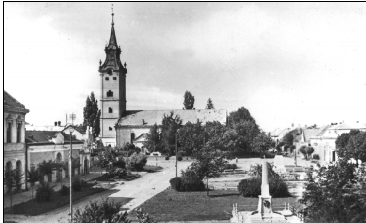
Hajdúnánás városközpontjának látképe az 1950-es években