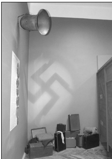
„Kitaszítottak” kiállítás, Hajdúnánás, 2011.

A magyarországi zsidók megkülönböztetésére már az első világháborút követően is sor került, de csak a két világháború közötti időszak végén öltött súlyosabb formákat. A felsőoktatási tanulmányokat korlátozó numerus clausus , a zsidótörvények és az 1930-as évek második felétől egyre inkább radikalizálódó közélet jelentette az előzményét annak a példátlan nyílt zsidóüldözésnek, ami Magyarország német megszállása után vette kezdetét.