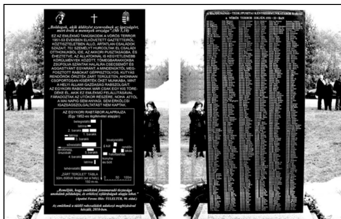
A tedejpusztai rabtábor emlékműve

december 7-én kezdte meg működését 343 rabbal, de a Tedejen fogva tartott kitelepítettek száma már 1951. december végére 661-re emelkedett. 28 Jelenleg a Hortobágyi Kényszermunkatáborokba Elhurcoltak Egyesületének köszönhetően több mint 700 egykori tedeji rabról van tudomásunk. A 12 szögesdróttal elkerített hortobágyi tábor felszámolására csak Sztálin halálát követően kerülhetett sor. 29