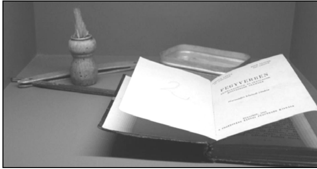
„Kitaszítottak” kiállítás, Hajdúnánás, 2011.

A Vörös Hadsereg legnagyobb rémtette azonban 1944. november 3-án éjjel következett be. Egy tudatos és szervezett akció során a polgári lakosság begyűjtésére, és mint később kiderült hadifogságba szállítására került sor ezen az éjszakán. Katonai alakulatok jártak házról házra és összegyűjtötték az otthon talált férfiakat, a fiatalokat és az öregeket is. Az egész városra kiterjedő akcióból csak egy-két városszéli utca, valamint a tanyák maradtak ki, ide ugyanis már nem jutottak el virradat előtt az oroszok. 15 Egyes vélemények, s általában a helyiek kollektív emlékezete szerint a szovjeteknek a visszaérkező munkaszolgálatosok is segítettek, akik így kívántak bosszút állni, mivel azok nem akadályozták meg a deportálásokat. 16 Az elhurcolások pontos oka hitelt érdemlően nem bizonyítható, tudjuk azonban, hogy a szovjet hadseregben bevett gyakorlat volt polgári személyek fogságba ejtése és hadifogolytáborokba szállítása. Szovjet hadifogságba egyébként mintegy 600 ezer magyar került, többségük katona volt, de a polgári személyek száma is elérte a 100–120 ezer főt. 17