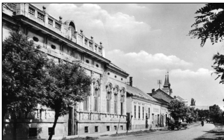
A kiállításnak otthont adó épületről az 1940-es években készült fotó

Ezután Debrecenből a hajdúnánási deportáltakat vagy Auschwitzba, vagy a Bécs mellett fekvő Strasshofba vitték. 8 Az Ausztriába került zsidóknak jóval nagyobb esélyük volt a túlélésre, mivel őket többnyire különböző kelet-ausztriai táborokba szállították tovább, ahol ipari és mezőgazdasági kényszermunkát végeztek velük. Az áldozatok pontos számát nehéz megállapítani, a jelenlegi szakirodalom mintegy 640 életét vesztett hajdúnánási zsidót tart számon. 9