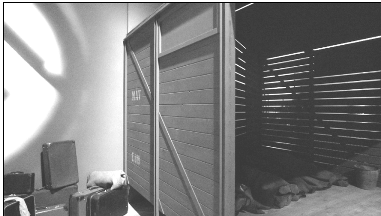
Kitaszítottak kiállítás, Hajdúnánás, 2011.

zsidósággal. 1 1944. március 19-ét követően, különösen a Sztójay-kormány március 22-i megalakulása után rendeletek sorát bocsátották ki a kormányzervek, amelyek többek között hatágú sárga csillag viselésére és rádiókészülékeik beszolgáltatására kötelezték a zsidókat, továbbá megtiltották, hogy tömegközlekedési eszközökön utazzanak, vagy nyilvános fürdőket látogassanak. 2 Nem sokkal ezután megkezdődött elkülönítésük is. Ebből a célból vidéken gyűjtőtáborokat, míg a nagyobb városokban külön gettókat hoztak létre, ahol mind az őrzésük, mind a későbbi szállításuk is szervezeten biztosítható volt. Magyarországról a zsidókat szállító első vonatok 1944. május 15-én indultak el vidékről Kassán keresztül Auschwitzba és június végéig 440 ezer embert, a vidéki zsidóság többségét már deportálták is. 3