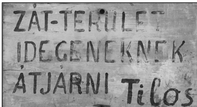
Az egykori tedeji tábor kerítésén elhelyezett tábláról készített fotó (A tábla Apatini Ferenc Illés a tulajdona, jelenleg a Terror Háza Múzeumban található)

A rendszer ellenségeivel szembeni fellépés eszköze volt a koncepciók perек mellett az internálás is. A legnagyobb internáló tábor Kistarcsán volt, a leghírhedtebb recski tábor működésének kezdete 1950-re tehető. Az internáló táborok száma megközelíthette a 100-at, míg a fogolylétszám 1953-ban 44 000 körül lehetett. 23