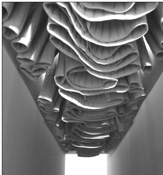
„Kítaszítottak” kiállítás, Hajdúnánás, 2011.