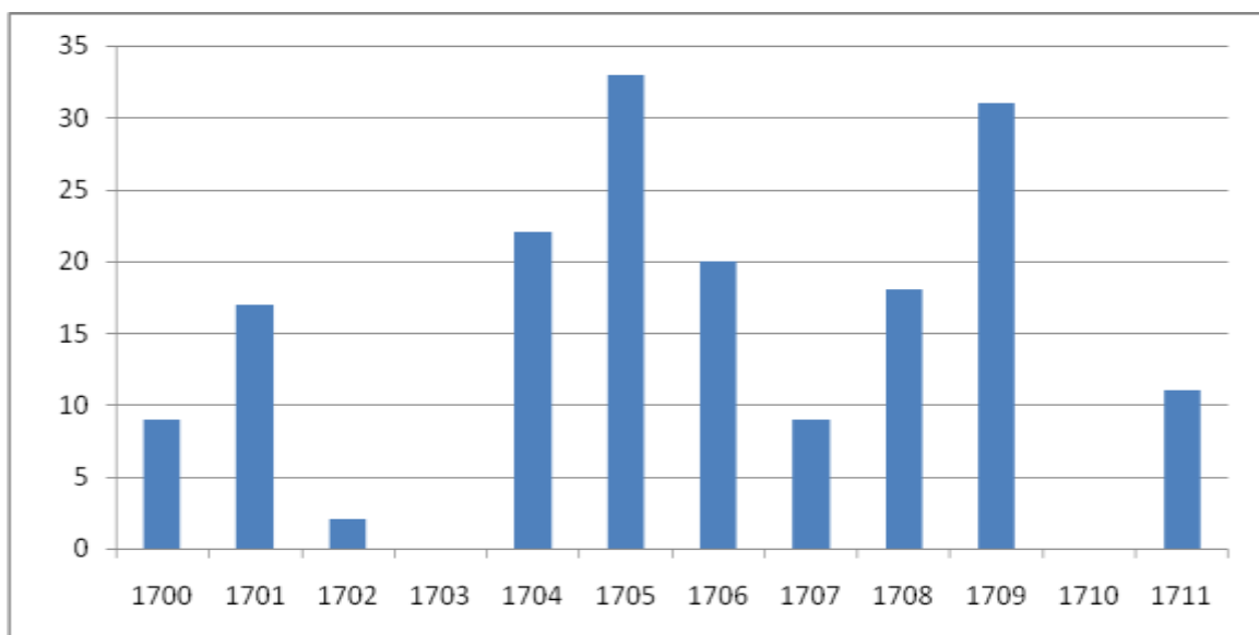
1. sz. ábra: A közgyűlések évenkénti megoszlása

Ha átlagként az évi huszonegy gyűlést vesszük, akkor jól látható, hogy a vizsgált ciklusban összesen három évben ülészetek ennyi vagy ennél több alkalommal. 505 A hajdúvárosok számára kiemelkedő évekből (1702, 1703 és 1710) ellenben minimális vagy semmilyen adattal sem rendelkezünk, a kialakuló háborús helyzet nem teremtett megfelelő helyzetet a tanácskozások megtartásához.