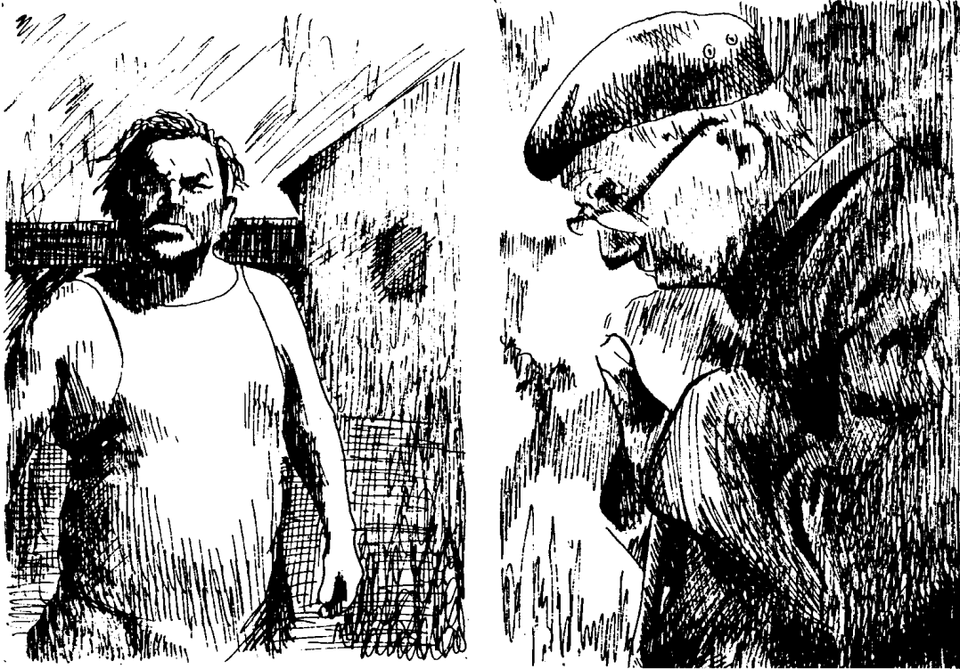
1. Zeichnung Gesten