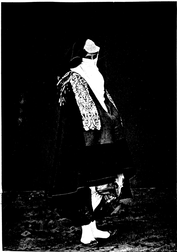
Albán városi kath. nő.