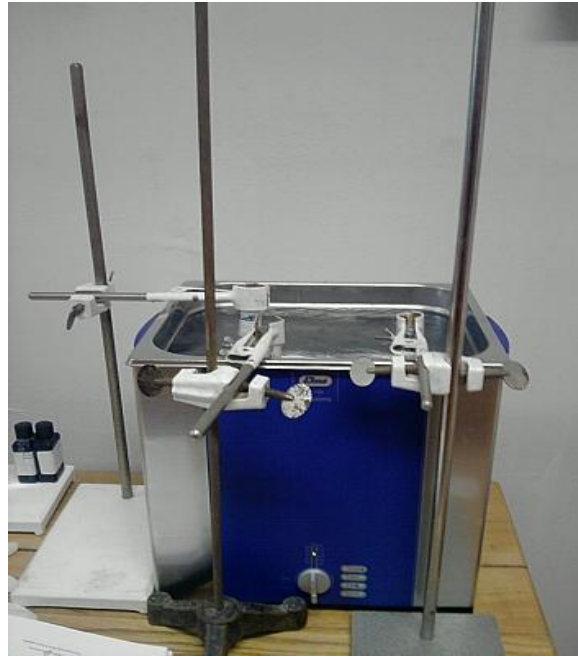
2. ábra: ELMASONIC S120 típusú ultrahangos készülék