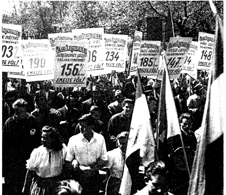
Archív kép: munkáfelvonulás 1951. május 1-jén. Jogalap nélkül is ítéleztek

Megállapítható, hogy a törvény szigorával sújtott „cselekmények” olyan társadalmi feltételek hiányából vagy nem megfelelő meglétéből fakadtak, melyek a korabeli iparosítás kényszerű,