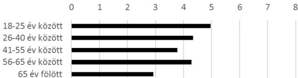
3. ábra. Az egyes korcsoportok átlagpontszáma az összes vizsgált településre vonatkozóan